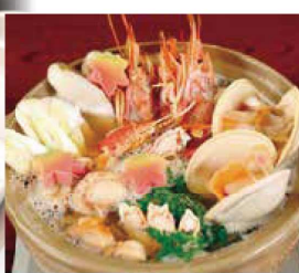
※イメージ画像の野菜は含まれておりません

5種類の海の幸を詰合せ。野菜などお好みの 具材を加え豪快に海鮮鍋をお楽しみください。 新鮮素材の旨みがたっぷり味わえます。